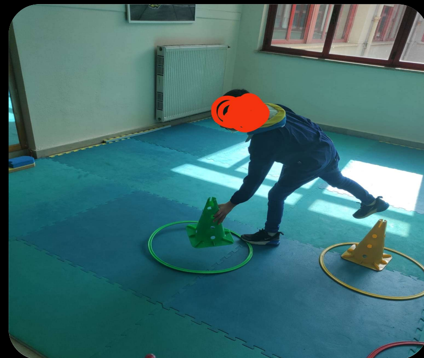
Aula di psicomotricità