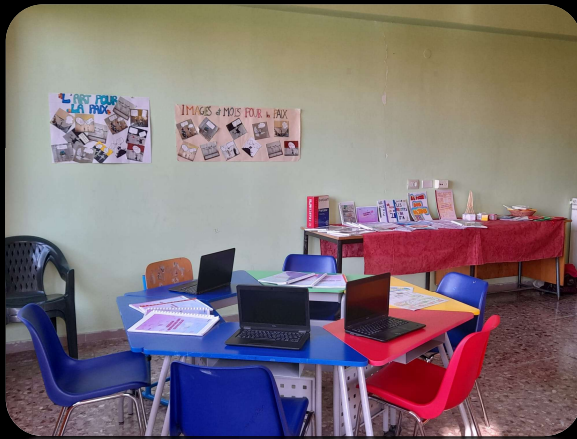
Laboratorio di Lingue Straniere