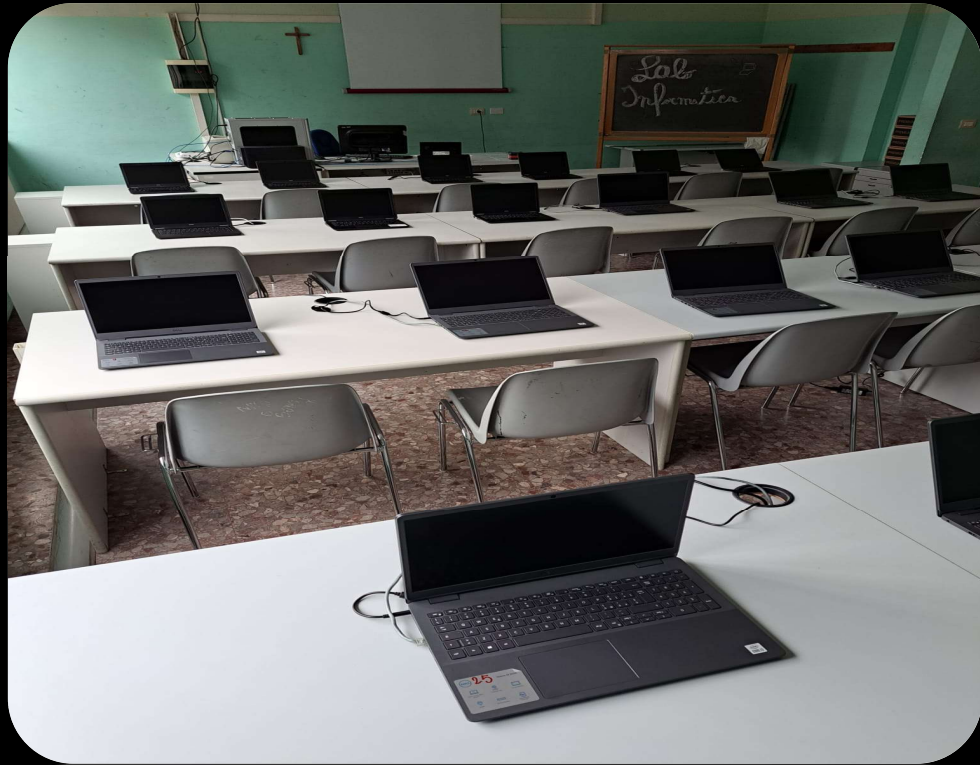
Aula di Informatica