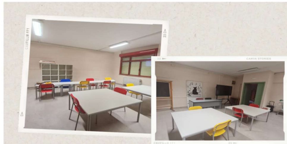
AULA ARTE & MUSICA