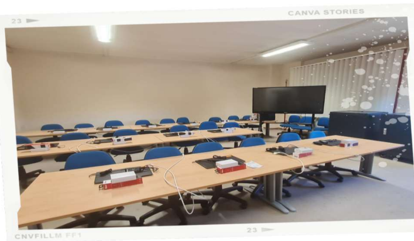
Aula di Informatica