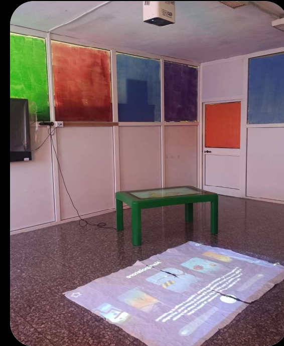
Aula Multimediale Polifunzionale