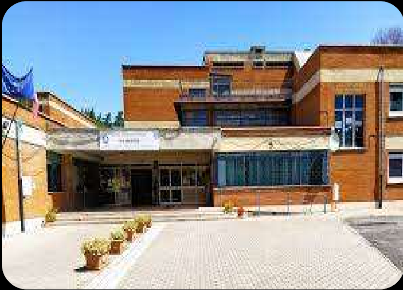
PLESSO VIA MEROPE