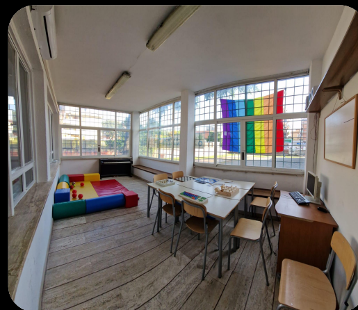
Laboratorio di Psicomotricità