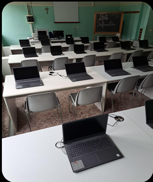
Aula di Informatica