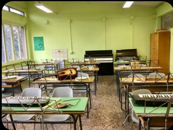
Laboratorio di Musica