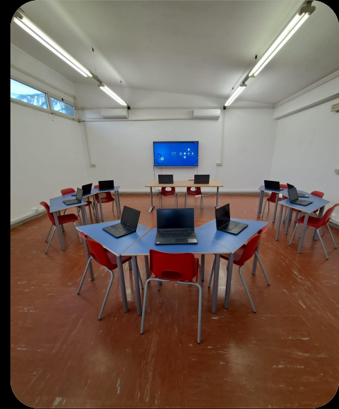
Aula Multimediale Polifunzionale