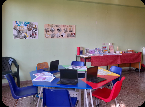
Laboratorio di Lingue Straniere